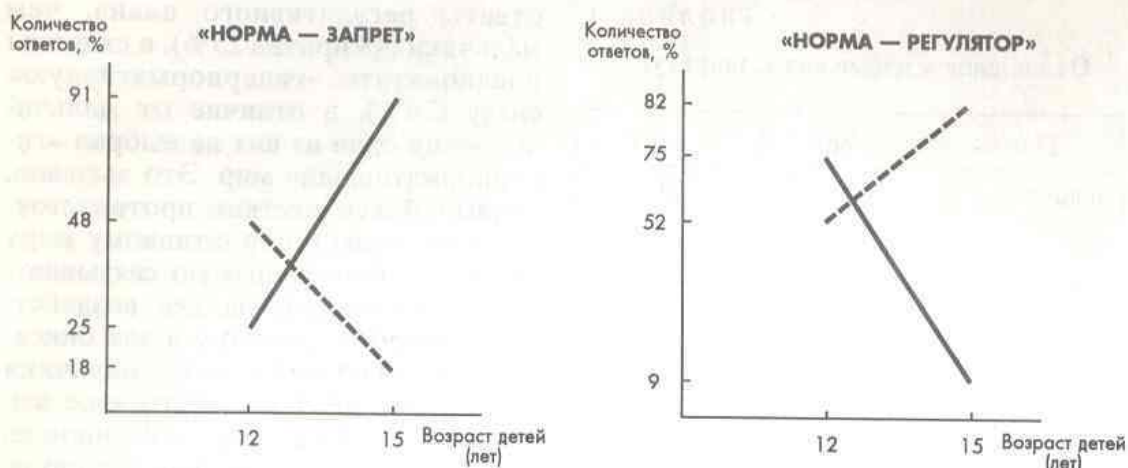
Рис. 3. Реципрокное (взаимобратное) отношение в нормативной динамике между полами: