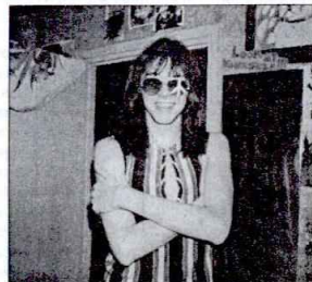
Рис. 12. Сальми и символы хитти. Москва, 1987 г.

Подобных связей еще недостаточно для развития полноценной группировки — необходимо ядро консолидации. Если, скажем, речь идет о металлистах, то им станет их центральный символ (тяжелый металлический рок) и все с ним связанное, особенно атрибутика. Отметим еще раз, что именно образующееся аморфное сгущение контактов, т. е. поле безличнос-