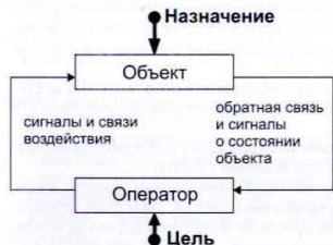
Рис. 2. Схема управляемой системы