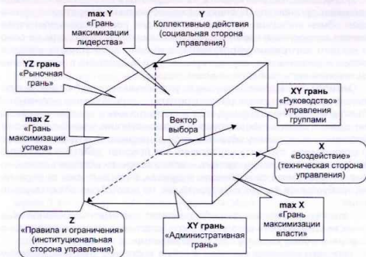
Рис. 3. Пространство выбора «интереса» управления

или интерес лиц, и предложить пространство выбора его ключевых факторов (см. рис. 3).